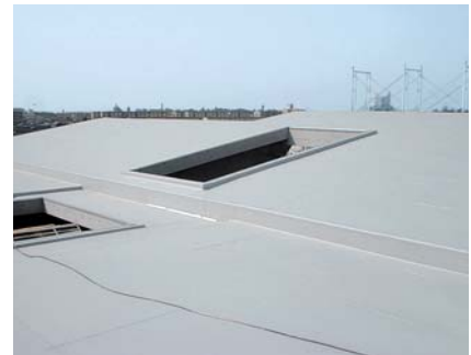
リベットルーフ施工完了