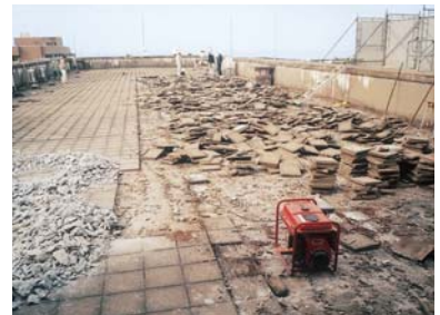
平板ブロック撤去作業